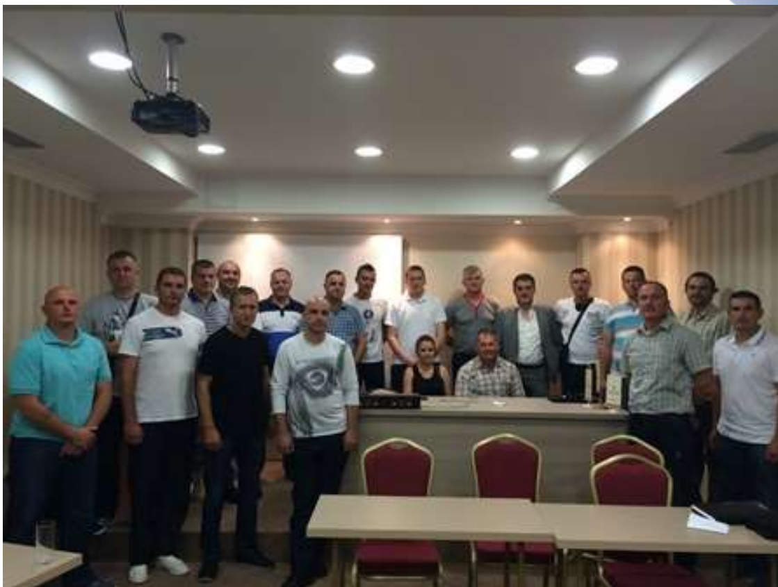
260 zatvorskog osoblja prošlo je obuku unapređenja ljudskih prava

DELEGACIJA EVROPSKE UNIJE U BOSNI I HERCEGOVINI