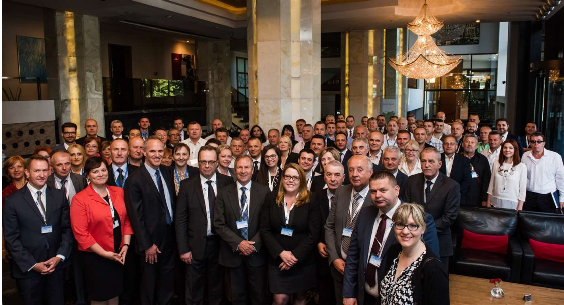
Evropska unija radi na usklađivanju zatvorskih praksi već više od deset godina u BiH

Projekat vrijednosti 1,32 miliona eura finansirali su EU i VE, od čega je EU izdvojila od 1,2 miliona eura, provodilo je VE od januara 2013. godine do juna 2016. godine. Među ostalim ciljevima, projekat je nastojao lokalnim kreatorima politike, prije svega ministarstvima pravde na svim nivoima, omogućiti dalji razvoj zatvorskih sistema i time ispuniti obaveze Bosne i Hercegovine koje proizilaze iz međunarodnih ugovora.