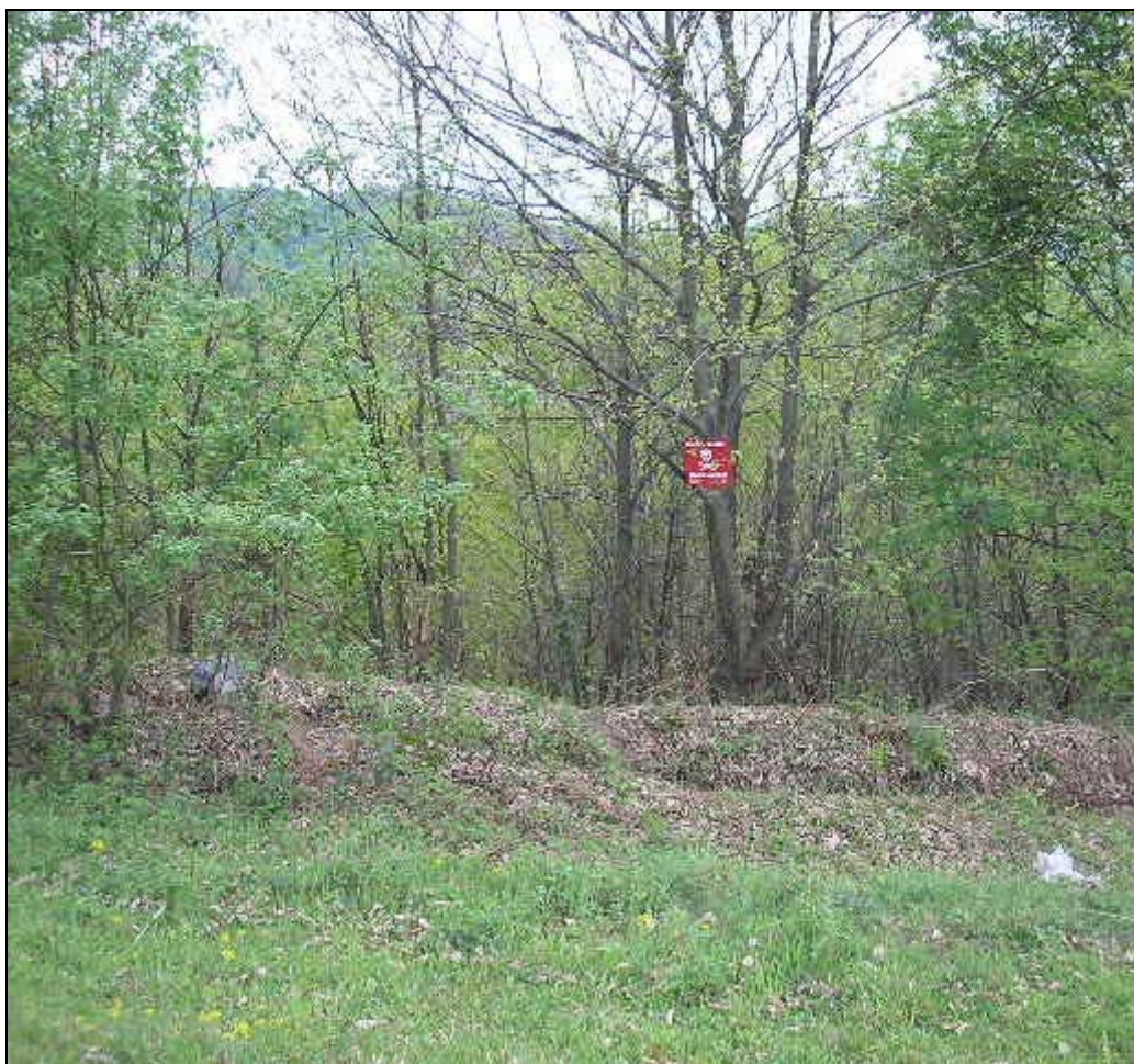
Photo taken from the point Y= 5 573 517 X= 5 000 690 at the angle of 180 degrees, direction marked on the map with an arrow.