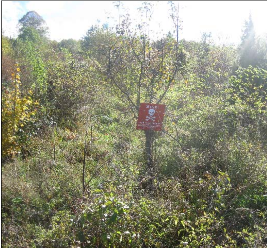
Photo taken from the point Y 5 582 727 X 5 003 450 at the angle of 143 degrees, direction marked on the map with an arrow.