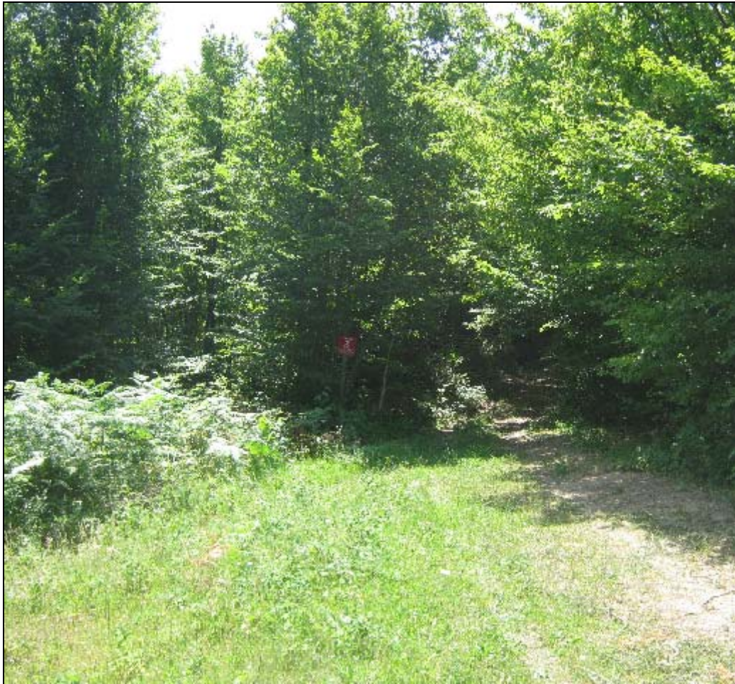
Photo taken from the point Y=5562064 X=4998508 at the angle of 202 degrees, direction marked on the map with an arrow.