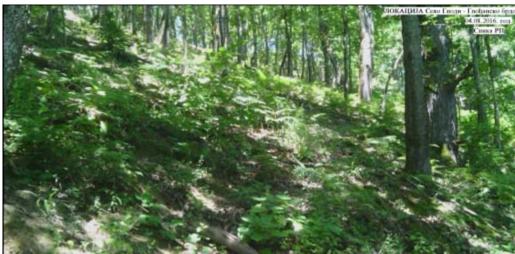
Photo taken from the point y=6584571 x=4909050 under the angle of 28 degrees, direction marked on the map with an arrow.