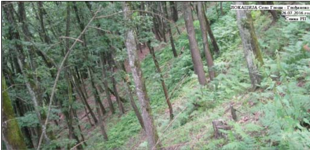
Photo taken from the point y=6584391 x=4909067 under the angle of 194 degrees, direction marked on the map with an arrow.