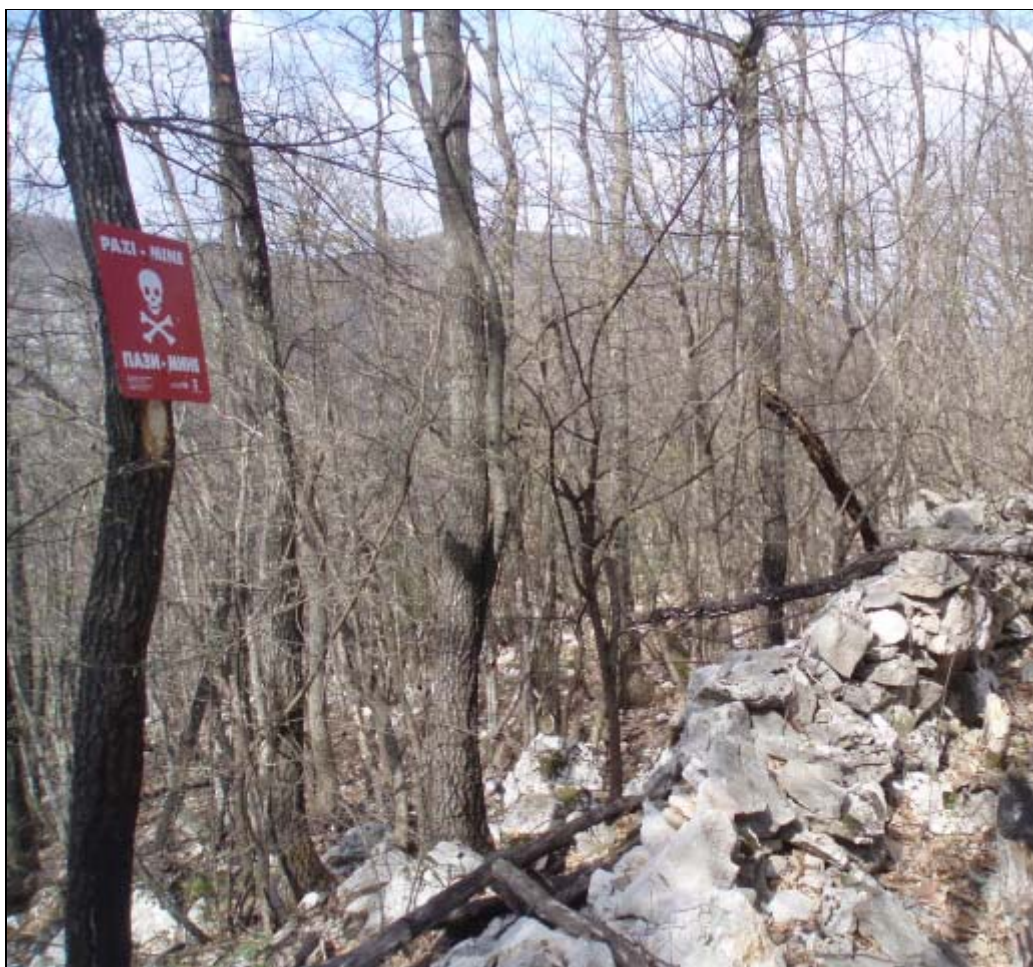
Photo taken from the point Y 5 572 072 X 4 958 592 at the angle of 350 degrees, direction marked on the map with an arrow.