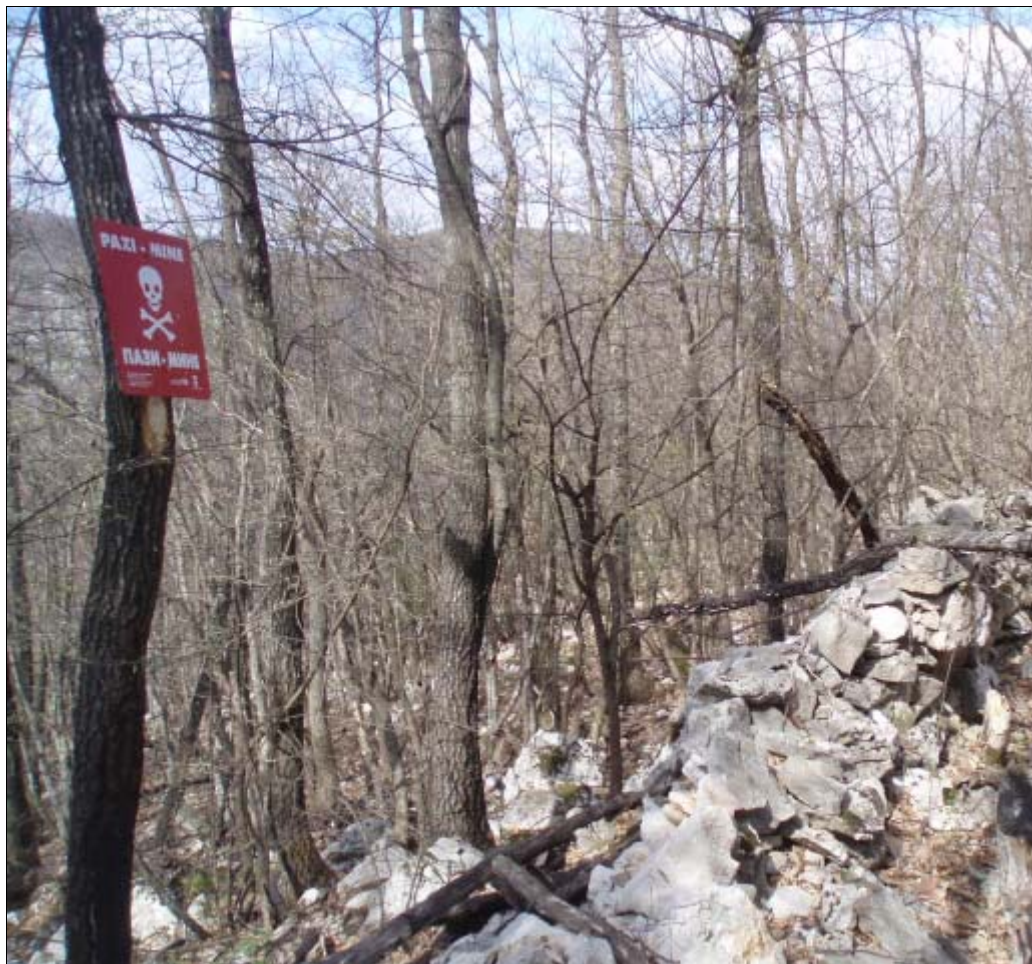
Fotografisano sa tacke Y 5 572 072 X 4 958 592 pod uglom od 350 ° a pravac fotografisanja od tacke oznacen je na karti strelicom.