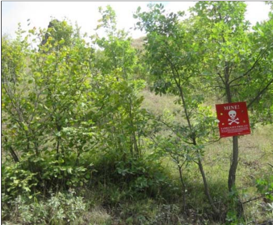
Photo taken from the point Y= 6 450 136,00 X= 4 884 385,00 at the angle of 290 degrees, direction marked on the map with an arrow.